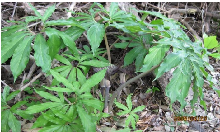
ウラシマソウ:金子氏林 2008/4/23