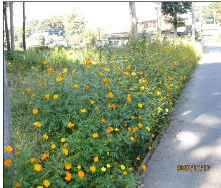
金子氏林の道路際に種を蒔き花を咲かせたポピーとキバナコスモス