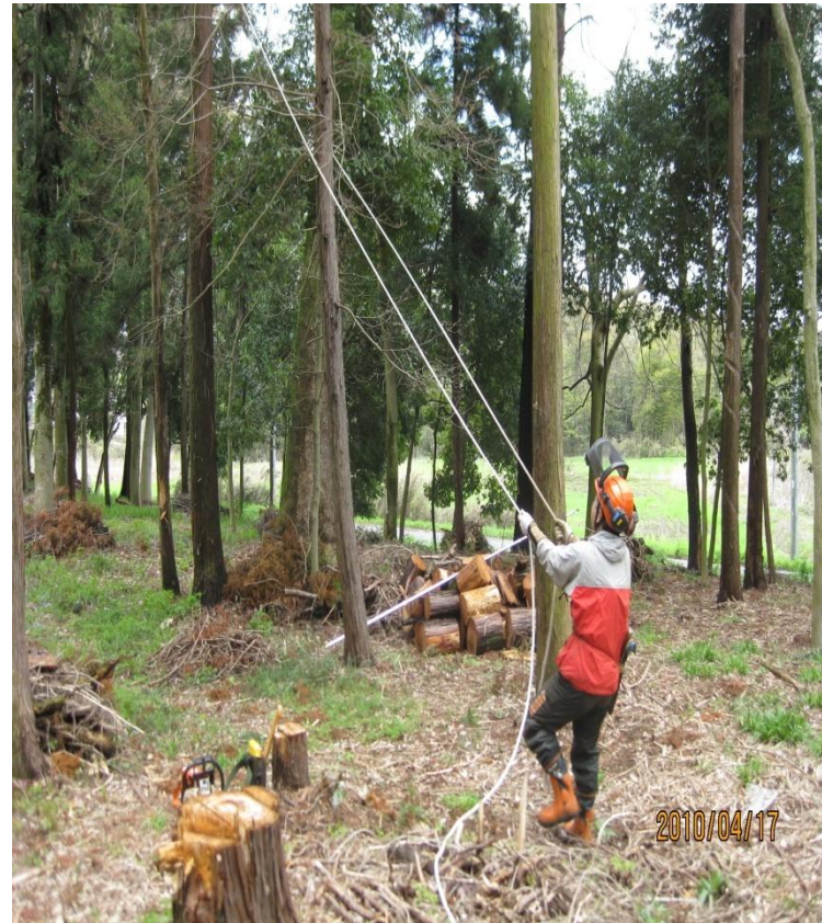
ロープワーク作業 2010/4/17