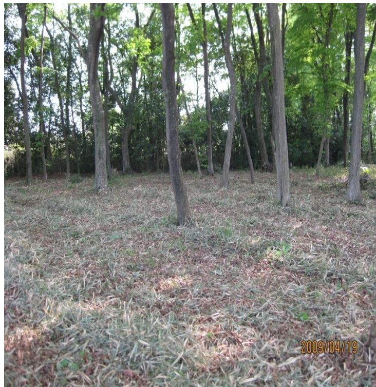
林床の下刈り作業後 2009/4/19