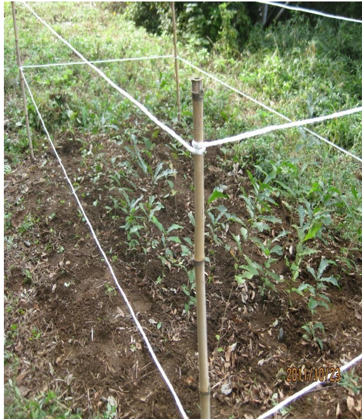
発芽し成長したクヌギの苗 2011/10/23