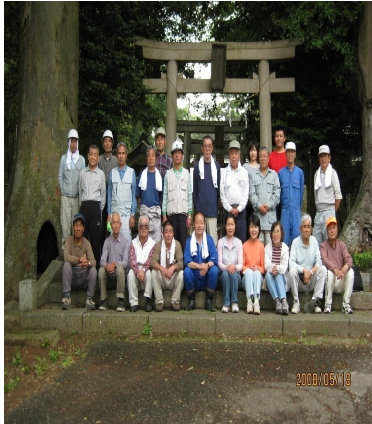
会員と神社総代の皆さん 2008/5/18