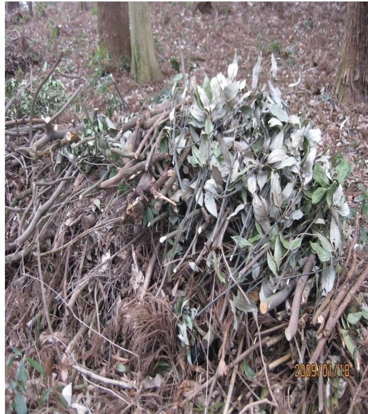
枝の積み方 藤岡神社林 2009/1/18