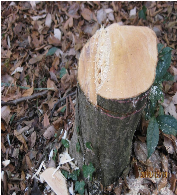
佐野氏林でチェーンソーによる切り株 2010/12/19