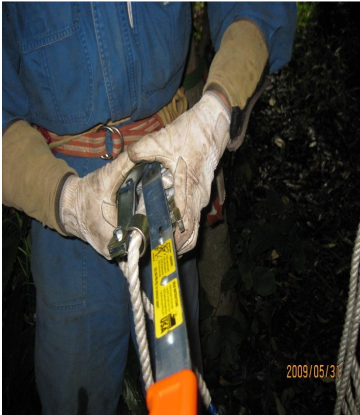
プラー (700kg 迄引けるけん引具) 2009/5/31