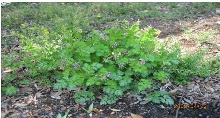
ムラサキケマン:同林 2009/4/23