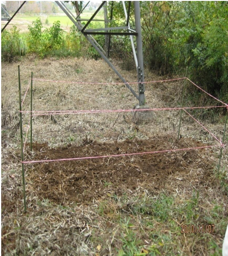
佐野氏林でのクヌギの種まき 2010/11/7