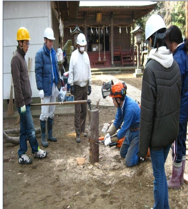
藤岡神社で講師を招きチェーンソーの講習会2010/2/21