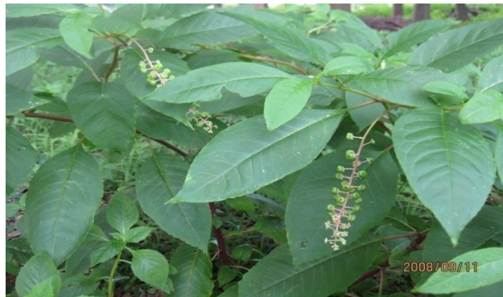
ヨウシュヤマゴボウ:金子氏林 2009/9/11