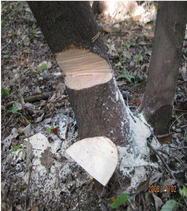
受口の水平と斜め切り 2008/11/2