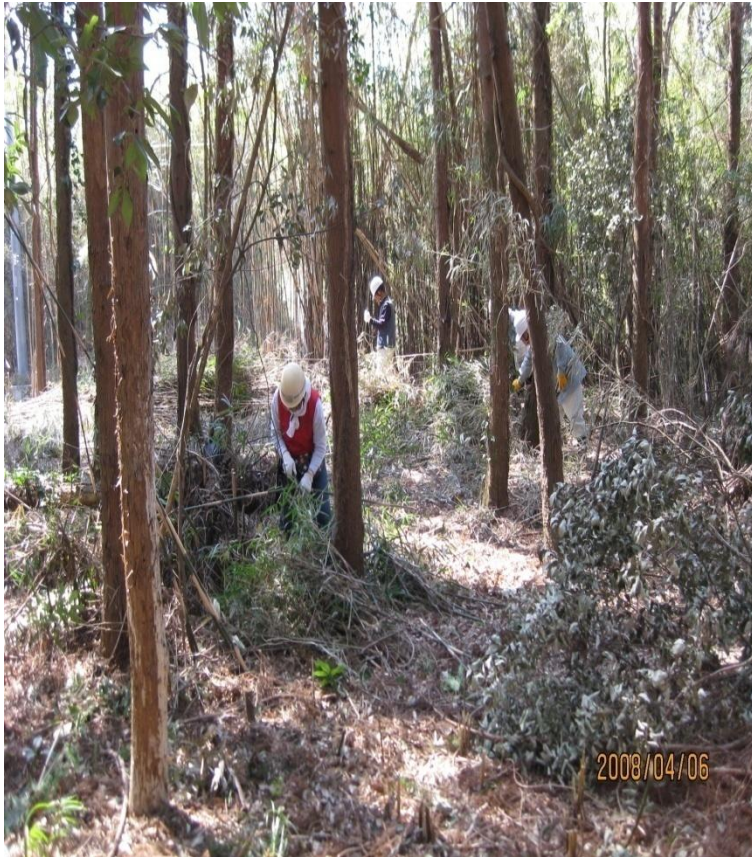
藤岡神社林での除伐作業 2008/4/6