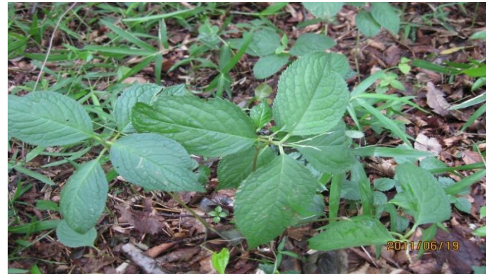
フタリシズカ:同林 2011/6/19