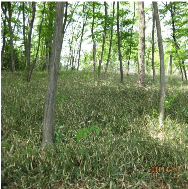
林床の下刈り作業前