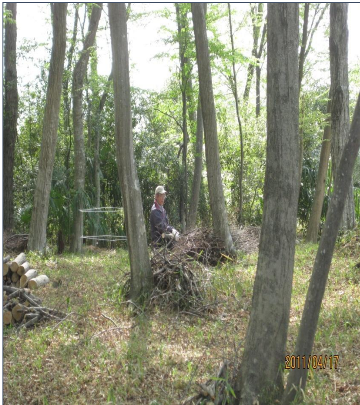
佐野氏林での枝処理作業 2011/4/17